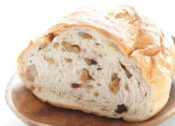
東京都 ABCベーカリー くるみバケット